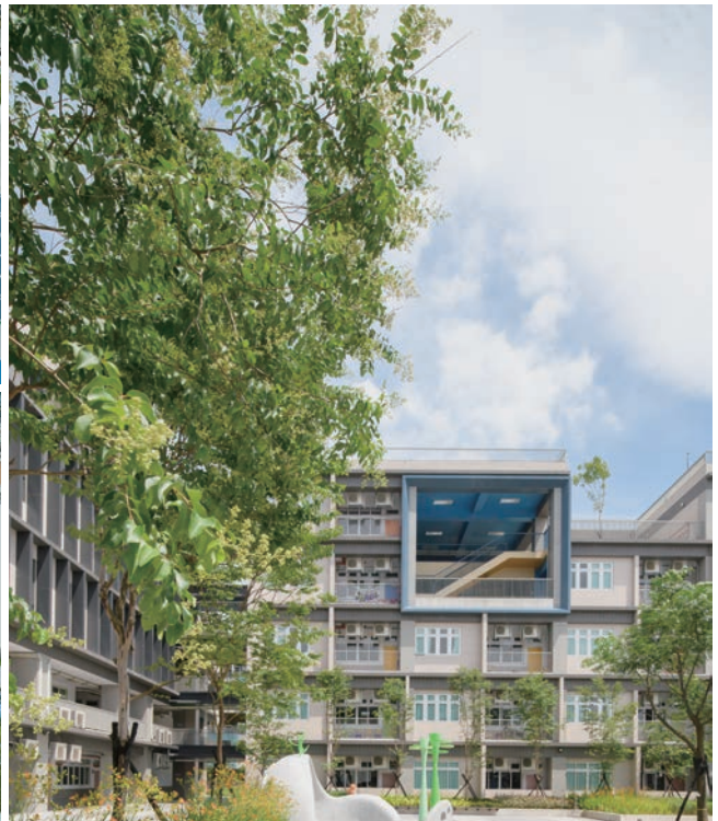
利用色彩與建築專業，在老舊的校舍中賦予全校師生不同的空間體驗，以設計改變生活與社會。