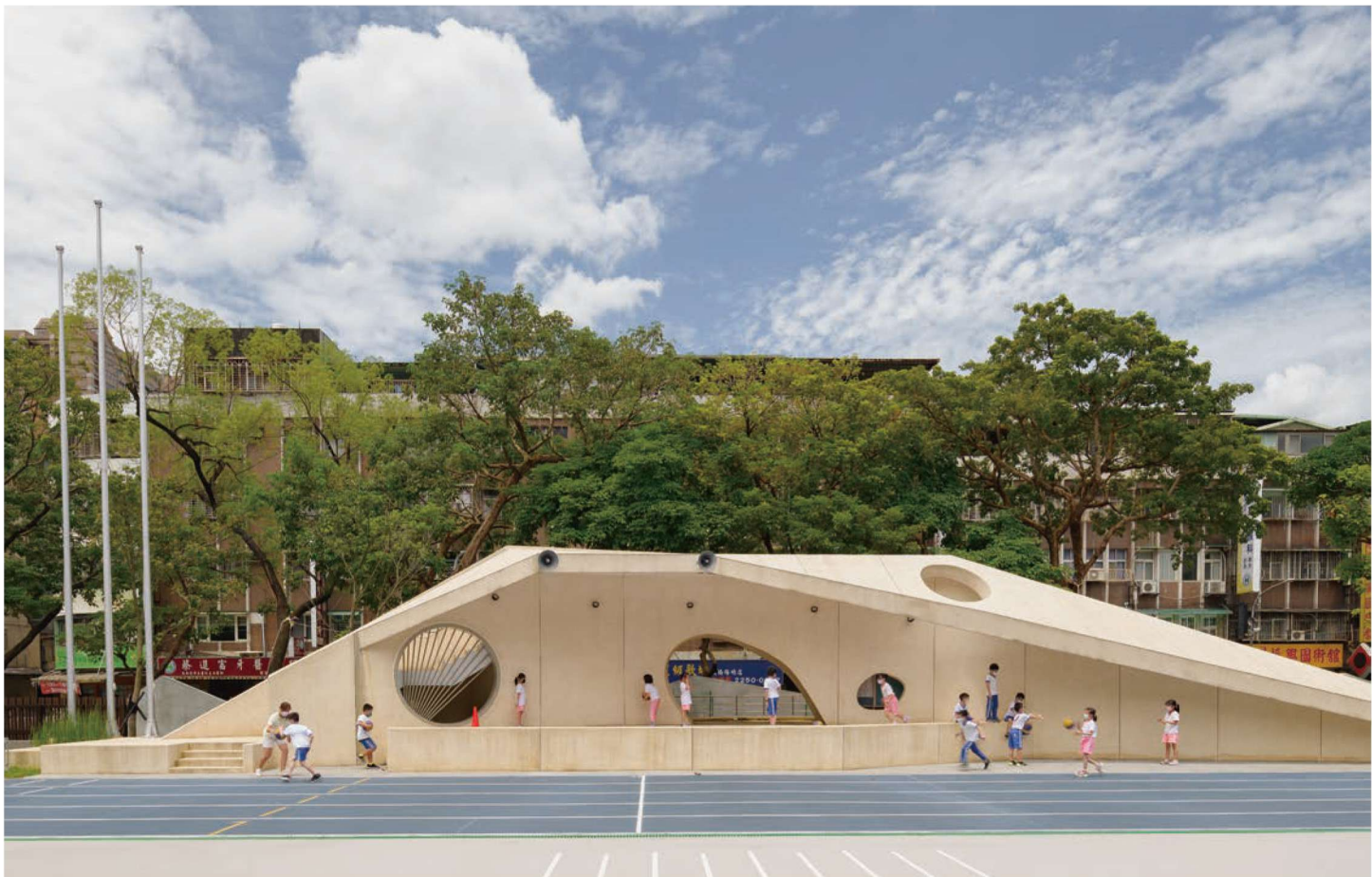
(上)板橋新埔國小的校舍改造案，在設計中結合對教育思維轉變的觀察，讓校園變得更活潑友善。(下)司令臺設計跳脫傳統框架，結合溜滑梯設計化為大型遊具，翻轉過去教育的威權印象。讓孩子爬到司令臺上方的大膽作法，在完工後獲得學生們的肯定。