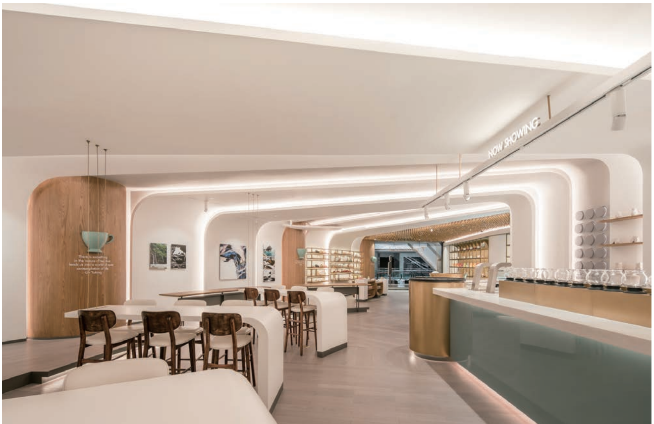
(上) 大陸茶店品牌「茶劇場」的上海店空間由兩人攜手設計打造，空間不僅獲得國外雜誌青睞，更在2018年榮獲空間設計類金點設計獎。(下) 設計概念來自於古代劇場，利用茶杯、茶匙等小物件重組，翻轉空間與物件的比例，創造視覺的衝突與效果。