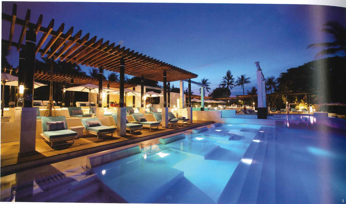
1. 渡假村由法國設計師 Mark Hertrich 賦予整體全新樣貌。 2. 以紅色及白色道出峇里島的熱情洋溢。 3. 峇里島第二座成人靜池。

建築、樹、海洋，成就隨性愜意 踱過稀疏人潮的海灘，步入客房，延續公共空間木構架元素，以黃和紫色系陳設眠臥寢具，輕微調整更為放鬆愜意的居住質感，房屋周圍依然種植大量熱帶樹叢，並可透過樹叢遙望海洋，如此一來，建築、樹、海洋的漸進層次便能傳遞度假氛圍，讓旅人藉著環境融入自然隨性，舒暢而恣意，並於生活雜物如碗盤以陶質，抑或草蓆等天然粗糙的肌理，賦予手感溫度，呈現與都市旅館追求精品細緻的極大差異性。